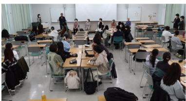
最初に、講師役のかがやきクラブ6名のご紹介です

令和6年11月12日に神奈川県立よこはま看護専門学校の1年生の授業「老年看護学概論・高齢者とのコミュニケーション」において、二俣川NTTかがやきクラブ連合会から6名の方に講師として来ていただきました。看護師を目指す上でコミュニケーションの力はとても重要です。この授業は、2年前から二俣川ニュータウンにお住いの高齢者の方にご協力をいただき進めているものです。お越しいただいた6名の方は、ご自身の人生を振り返りながらこれまでの経験について活き活きとお話をしてくださいました。学生達は、講師の方々の生きてこられた過程や価値観を理解すること、長い人生経験がある方へ尊敬の念をもって寄り添った関わりをするのが大切であること等を学び、大変有意義な授業となりました。地域の方々と交流が、看護師として成長する上で大きな力になります。授業にご参加いただいた二俣川NTTかがやきクラブ連合会の皆様、ありがとうございました。