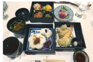
八王子の料亭なか安で昼食。豪華なランチでした

昼食は八王子の料亭なか安です。料亭で提供されるお食事はやはり立派ですね。堪能しました。旅最後の高尾山は、ケーブルカーを利用したので高齢者にも優しく、ウォーキングがてら紅葉を楽しみました。お天気にも恵まれ、素敵なバス旅行でした。