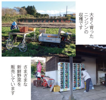
大きく育った ニンシンの 収穫です