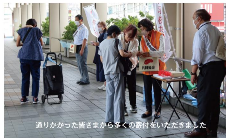
通りかかった皆さまから多くの寄付をいただきました