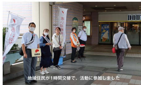
地域住民が1時間交替で、活動に参加しました

全国で寄付いただいたお金は、7割が各地域の福祉活動(社協、福祉施設、ボランティア団体等)の助成金として、残り3割が広域の福祉活動(災害時の支援活動等)に分配されます。寄付していただいた皆さま、ありがとうございました。