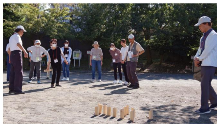
モルック競技は、ピンを倒して点を競います