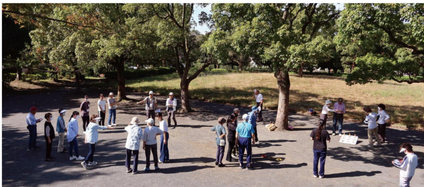
あきにれ公園で、一緒にモルック競技や輪投げを楽しみました

モルック競技と輪投げを終えた後は、連合町内会館に戻り参加者全員で懇談会を行いました。高齢者の多くのメンバーからは、若い人を交えてのスポーツは高齢者にとって特別な時間のように感じ、とても楽しく、これからも続けてほしいと好評でした。参加した学生さんからは「高齢者という言葉のイメージが変わった」「健康に過ごされている要因が生活の一端にあることがわかった」との感想がありました。この体験学習を通して学生さんたちが一段と成長されることを願っています。