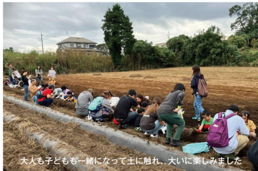
大人も子どもも一緒になって土に触れ、大いに楽しみました