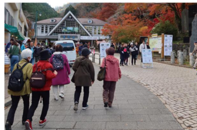
高尾山のケーブルカー乗り場。紅葉がきれいです

<編集後記>2年ほど前から、近隣にある県立よこはま看護専門学校とニュータウン地区かがやきクラブとの交流が始まりました。看護専門学校では毎年7月に「やまゆり祭」を開催しているので、そこにかがやきクラブのメンバーが「ボッチャ競技」「着付け教室」にお手伝いで参加しています。一方、ニュータウン地区では毎年6月に社協主催の「福祉まつり」があり、そこに学生20数名が参加して「ロコモダンス教室」運営や模擬店のスタッフとしてお手伝いいただきました。2月8日(土)に旭公会堂で開催された「きらっとあさひ福祉大会」での交流活動を「学生と地域の交流から」として出陣社協会長が発表しました。