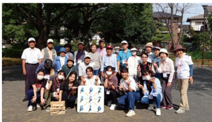
学生さんたちと参加したメンバーで記念撮影